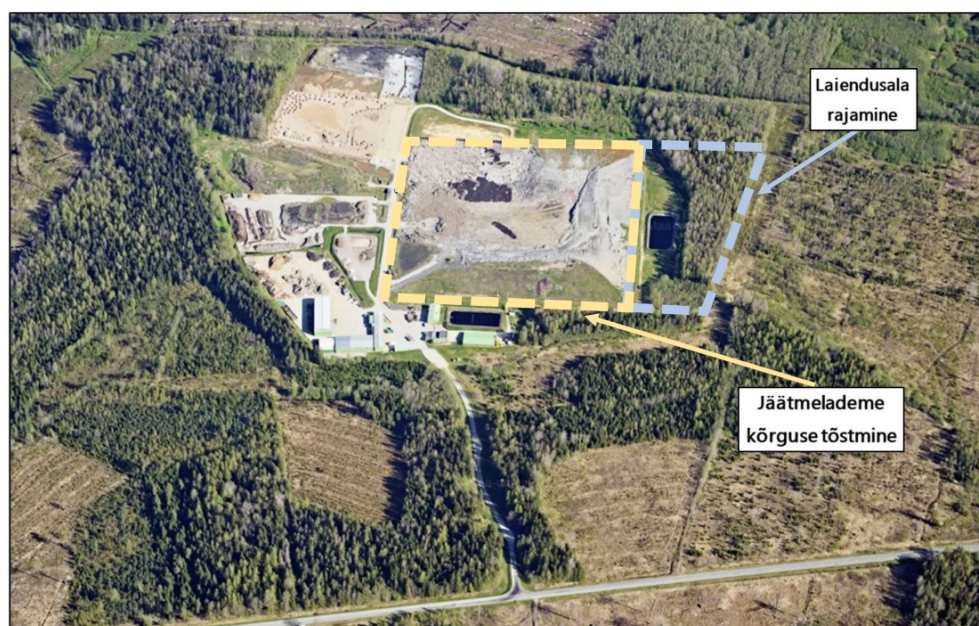
Joonis 2. Vaade Väätsa prügilale ja lähikümbrusele